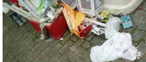
Sluikstorten blijft probleem p. 3