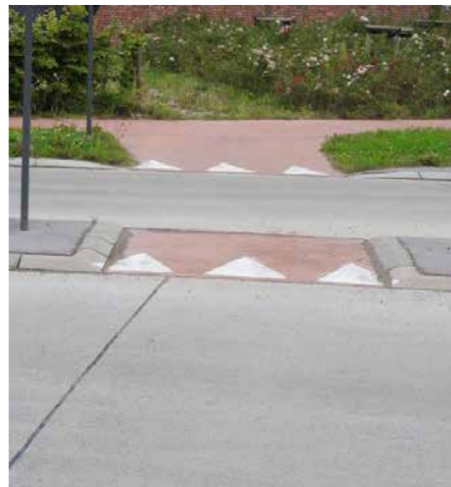
▲ Het is gevaarlijk dat fietsers op dit kleine stukje fietspad moeten wachten en voorrang verlenen aan de auto's.

De N-VA besluit dat dit geen politieke keuze mag zijn, maar wel een objectieve, technische en vooral verkeersveilige keuze moet zijn.