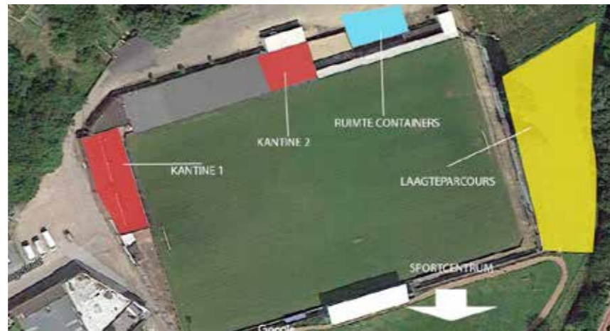
▲ Speelpleinwerking Zulderkippen heeft te weinig plaats. Verhuizen naar de site Konkelgoed is de ideale oplossing.

Pluspunt ook: (groot)ouders kunnen tijdens vakanties in de tuin van de Biekorf vertoeven met zicht op de spelende kinderen. Het bestuur ziet geen heil in het N-VA-voorstel en keurde het af.