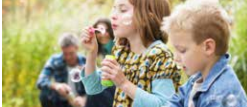
Speelpleinwerking Zulderkipken ruimte geven p. 2