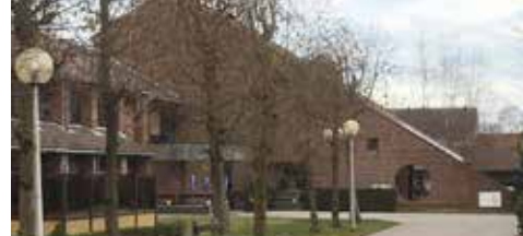
Woonzorgcentrum: N-VA krijgt gelijk p. 3