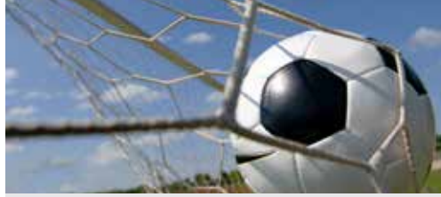
Voetbaldoelen onterecht verwijderd (p. 2)