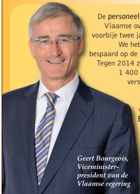
Geert Bourgeois, Viceminister- president van de Vlaamse regering

De personeelsbudgetten van de Vlaamse overheid daalden de voorbije twee jaar met 5 procent. We hebben ook drastisch bespaard op de werkingsmiddelen. Tegen 2014 zullen er bovendien 1 400 ambtenaren op de verschillende Vlaamse departementen niet stelselmatig vervangen worden. Een besparing van 50 miljoen euro per jaar!