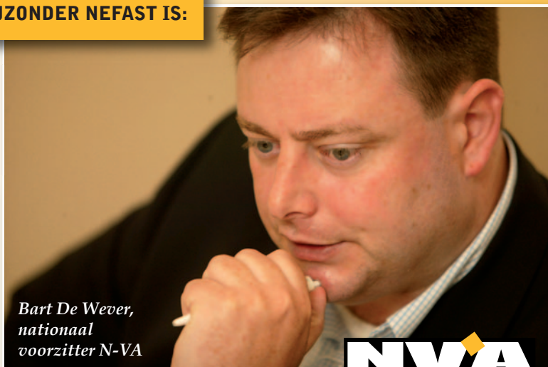
Bart De Wever, nationaal voorzitter N-VA