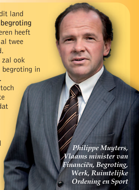
Philippe Muylers, Vlaams minister van Financiën, Begroting, Werk, Ruimtelijke Ordening en Sport

Als enige overheid in dit land heeft Vlaanderen een begroting in evenwicht. Vlaanderen heeft de voorbije twee jaar al twee miljard euro bespaard. De Vlaamse Regering zal ook de volgende jaren een begroting in evenwicht voorleggen. Als er geleidelijk aan toch wat budgettaire ruimte komt, investeren we dat zoals Europa vraagt: in onze economie (O&O, infrastructuur, werk ...) en in sociaal beleid (kinderopvang, wachtlijsten gehandicapten, kindpremie ...).