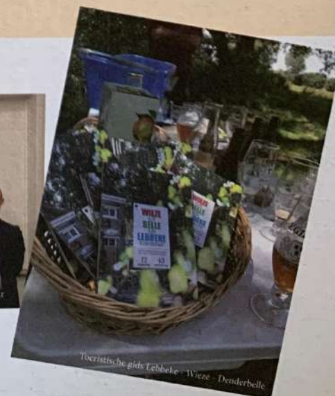
Toeristische gids Lebbeke - Wieze - Denderbelle