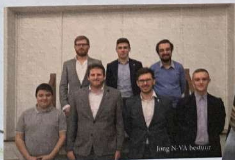
Jong N-VA bestuur