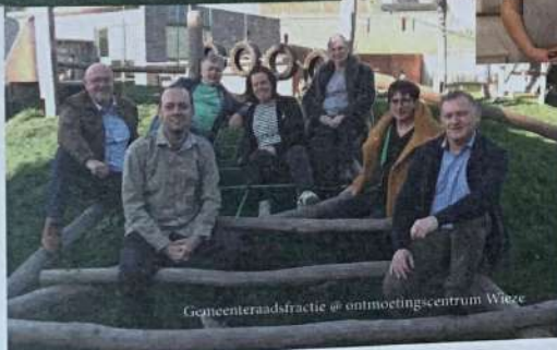
Gemeenteraadsfractie @ ontmoetingcentrum Wieze