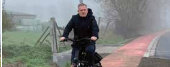
Heraanleg Opstalstraat (p. 3)