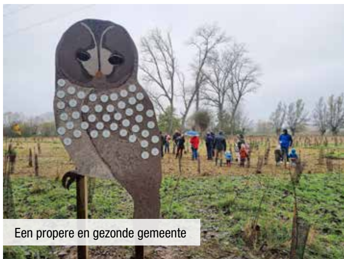
Een propere en gezonde gemeente

Onze inwoners moeten kunnen wonen in een propere en gezonde gemeente. Dat is al vanaf dag één een topprioriteit voor onze bestuursploeg. Samen met schepen van Leefmilieu Goedele Uyttersprot wordt die doelstelling vast en zeker bereikt. Hieronder kan u enkele (toekomstige) realisaties zien: