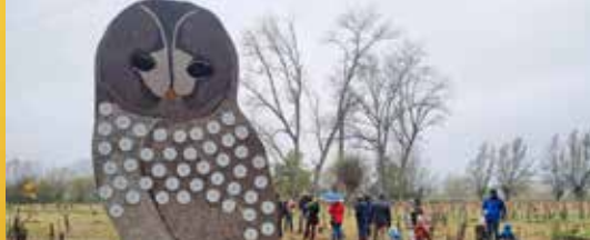
Propere en gezonde gemeente (p. 2)