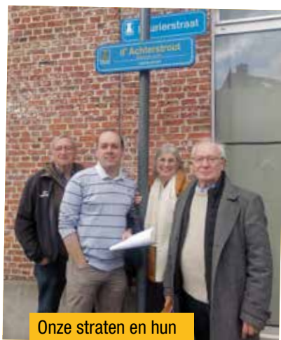
Onze straten en hun namen in het dialect