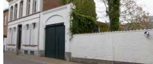
Herinrichting Lebbeke Centrum p. 3