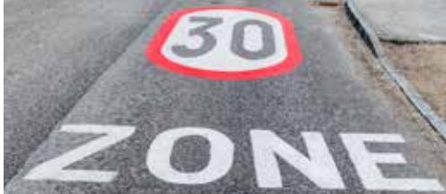
Zone 30 respecteren p. 2