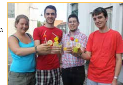
Jong N-VA Lebbeke met enkele lekkere cocktails: Die gaan ze ook serveren na de eerstvolgende gemeenteraad.

Zo worden alle soorten cocktails verboden op fuiven. Niet alleen zijn deze cocktails een grote bron van broodnodige inkomsten, ze bevatten vaak niet veel meer alcohol dan de reguliere pintjes. We stellen onszelf de vraag of deze regel ook zou gelden voor de jenevers rond de ijspiste? Een warme oproep naar de gedelegeerden in de Veiligheidscel: "Laat Lebbeke bewegen!" Jaag de jeugd alstublieft niet weg van onze fuiven met ondoeltreffende maatregelen, die de jeugdbewegingen treffen in hun nu al te min gevulde geldbuidel.