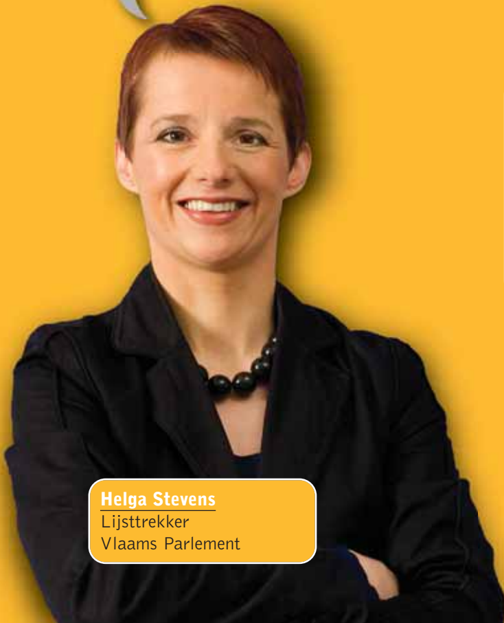
Helga Stevens Lijsttrekker Vlaams Parlement

“De crisis oplossen, dat kunnen we niet in een-twee-drie. Maar met een sterker Vlaanderen kunnen we ze wél veel beter opvangen.”