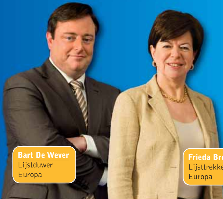
Bart De Wever Lijstduwer Europa

NVA NODIG IN VLAANDEREN. NUTTIG IN EUROPA.